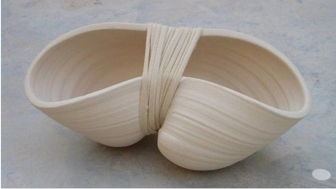
شكل ٩ Flickr Flicke.com

يظهر في الشكل الاسطواني اعتماد الفنان عل الملمس واللون وحد الرضية الشكل الخزفي باللون الابيض مع اضافة تجهير الثقوب والفتحات المنتظمة علي جدار الشريحة الخزفية بشكل هندسي واضح، تجهيزا للمكمل الذي ياتي دورة فيما بعد عملية الحريق، حيث حاك الخيوط اللونية بعد ذلك مستخدما الفتحات سابقة التجهيز علي جدار الشكل الاسطواني في تناغم لوني واضح اثري سطح الشريحة مما يوضح مدي قوة تأثير المكمل عل الشكل الخزفي.(شكل ١٠)